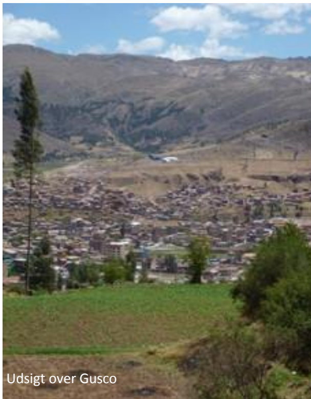
Udsigt over Gusco